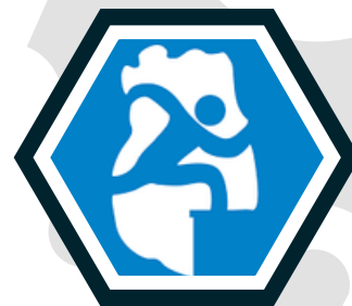
COKIMEN Colegio de Kinesiólogos y Fisioterapeutas de Mendoza