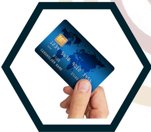
Tarjeta de Crédito