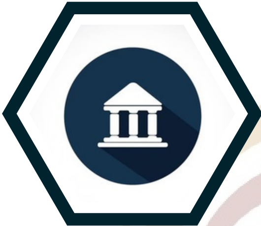
Depósito o Transferencia bancaria